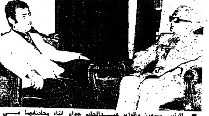
الرئيس شمعون والوزير جيهدا الحليم حدام أثناء مباحثتهما امس وزارة الخارجية السورية

تابع موشه دايان وزير الخارجية الاسرائيلي لجنة الغيبضة الدبلوماسية امس فيمباردة اسرائيل بطريق الجو تيل اربع ساعات من الوقت المتوقع ، ووصل في وقت لاحق الى نيويورك بطريقه الى واشنطن . وتابع رجال الصحافة الذين تجمعوا في مطار بن غوريون في تل ابيب ان وزير الخارجية قد أصبح في منتصف الطريق الى زورخ على متن طائرة تابعة لشركة الطيران السويسري غادرت المطار عند الساعة السابعة صباحا . وكانه يقصد زورخ وليس نيويورك مباشرة ، كما كان قد اعتقد قبل ايام من حدة الغموض حول سبب عودته السرية الى اسرائيل اول امس في حين كان من المفروض ان يكون في طريقه لتلقي مهمة دبلوماسية حاسمة في نيويورك .